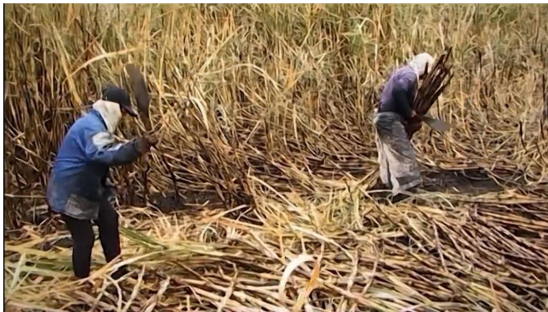
Trabajadores de la zafra en "Bialet Masse: 100 años después" (Sergio Iglesias, 2006). El documental recorre los lugares retratados por Bialet Masse en su informe "Estado de las Clases Obreras Argentinas" (1904).

En las estadísticas brindadas por la SRT, tanto en sus reportes anuales de siniestralidad laboral (donde los siniestros aparecen desagregados por provincia, sector económico, etc.) como en los más recientes informes de género, migrantes y grupos etarios podemos hallar insumos de gran utilidad. No obstante, teniendo en cuenta el alcance limitado de los trabajadores y trabajadoras cubiertas por el sistema, según el caso o rama de actividad a analizar puede ser necesario complementar la información brindada por la SRT con datos relevados a partir de distintas metodologías (por ejemplo, en una investigación de Panaia publicada en el año 2008 sobre los siniestros en la industria de la construcción –y dado el elevado índice de informalidad en el sector- la investigadora recurrió también a entrevistas a los trabajadores y sus familias y a la consulta de las planillas de las guardias médicas en los hospitales).