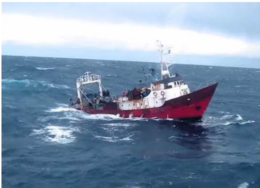
Barcos de papel (Fernando Duarte, 2020). Documental que narra el caso del hundimiento de "El repunte" y da cuenta de las condiciones de trabajo de los pesqueros.