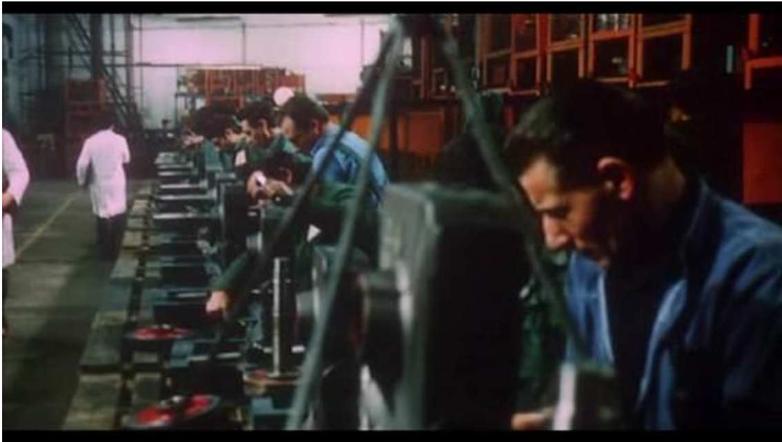
La clase obrera va al paraíso (Elio Petri, 1971). En este drama político Gian María Volonté interpreta a un obrero metalúrgico que se ve a sí mismo como una herramienta del proceso de trabajo.