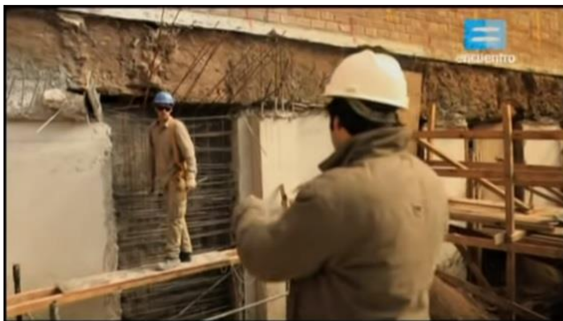
"Fuera de Riesgo" (2012). La co-producción de la Superintendencia de Riesgos del Trabajo y el canal Encuentro constó de 4 capítulos: metalúrgica, construcción, agro y aserraderos.

Hemos comenzado este recorrido de posibles líneas de intervención e investigación a partir de los imaginarios o representaciones sociales, señalando que, entre otros, un corpus de investigación posible podría ser aquél que viene dado por las normas que instituyen el sistema de riesgos del trabajo. Ahora bien, aun cuando no trabajemos específicamente con estas normas en tanto unidad de análisis (y más allá del análisis de las representaciones), entendemos que el cuerpo de leyes y reglamentaciones deberá tenerse en cuenta al momento de realizar cualquier otro tipo de análisis o intervención comunicacional. En este sentido, cabe señalar que un digesto actualizado puede encontrarse en el sitio https://digesto.srt.gob.ar .