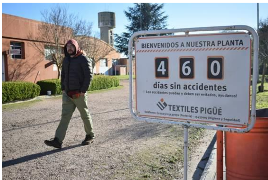
Cartel en la entrada de la Cooperativa de Trabajo Textiles Pigüé (fotografía sacada en agosto de 2017 durante el VI Encuentro Internacional La Economía de los Trabajadores)

baja, y hasta la probable desaparición, de accidentes de trabajo en empresas recuperadas probablemente guarde relación con la alteración, en el sentido de una disminución, de los ritmos de producción (que a veces, en contrapartida, puede venir acompañada de una extensión de la jornada de trabajo).