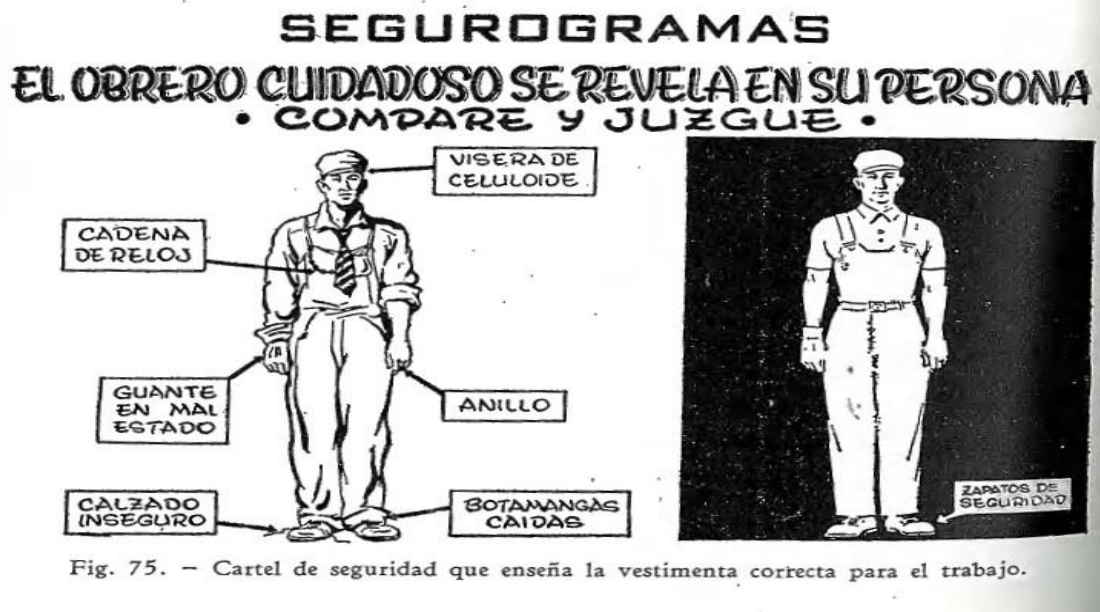
Fig. 75. – Cartel de seguridad que enseña la vestimenta correcta para el trabajo.

Un trabajo de particular relevancia, en torno a las representaciones de las y los trabajadores, es la investigación documental de Victoria Haidar (2016) acerca del factor humano en la explicación de los accidentes de trabajo. Haidar rastreó la persistencia de la noción de “error humano” o “comportamientos inseguros” (atribuidos siempre a las y los trabajadores) en numerosos documentos relacionados con las políticas de seguridad e higiene de grandes empresas (ACINDAR, Shell, Quilmes), así como también en diversos artículos de la prensa especializada. Otra metodología de investigación posible -y no excluyente- es la que podría llevarse a cabo mediante entrevistas en profundidad y cuestionarios estructurados o semiestructurados a los distintos actores de una empresa, o en alguna rama de actividad, etc.